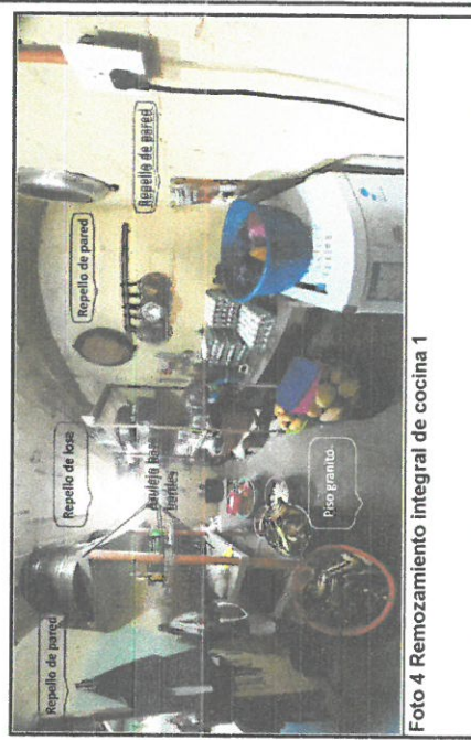
Foto 4 Remozamiento integral de cocina 1