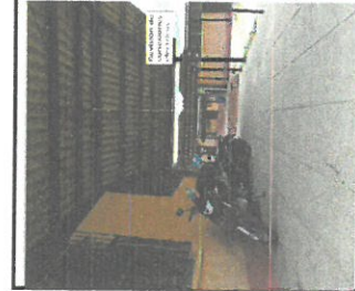
Foto 10 reparación de sistema eléctrico en mal estado