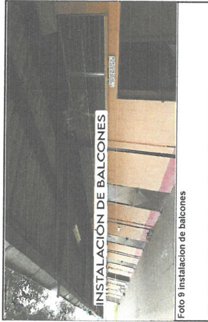
Foto 9 instalación de balcones